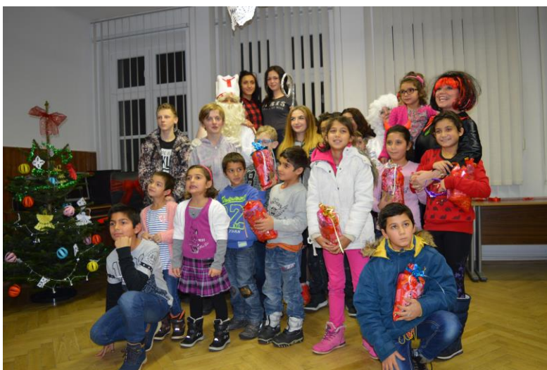
Mikuláš s pracovníkmi Komunálnej poisťovne

Spolupracujeme s SPDDD Úsmev ako dar, Dobrý anjel, Mondí SCP, Nadácia Supra, Komunálna poisťovňa, Partneri pre sociálny rozvoj a pomoc Prešov, Domovské vzdelávacie centrum Dunajská Lužná, Dobrý pastier Kláštor pod Znievom, Kaufland, Panta Rhei, Penzión Blesk, OZ Lokál Komunitná nadácia Liptov, CPPPaP Ružomberok,