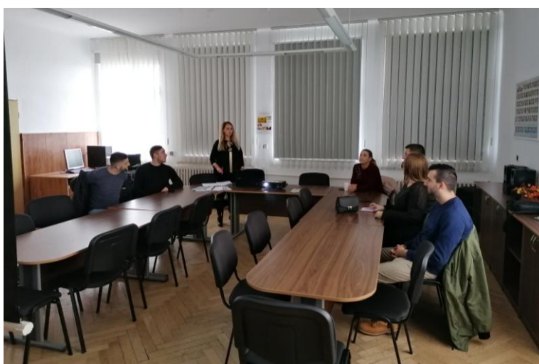
Prednáška a diskusia so študentmi Katolíckej univerzity v Ružomberku

Spolupracujeme so Spoločnosťou priateľov detí detských domov Úsmev ako dar, Mondi SCP, Nadáciou Supra, Komunálnou poisťovňou, Občianskym združením Partneri pre sociálny rozvoj a pomoc Prešov, Nadáciou Domovské vzdelávacie centrum Dunajská Lužná, Občianskym združením Dobrý pastier Kláštor pod Znievom, Panta Rhei, Penziónom Blesk, OZ Lokál Komunitná nadácia Liptov, Centrom pedagogicko-psychologického poradenstva a prevencie Ružomberok, Centrom pedagogicko-psychologického poradenstva a prevencie Liptovský Mikuláš a Katolíckou univerzitou v Ružomberku.