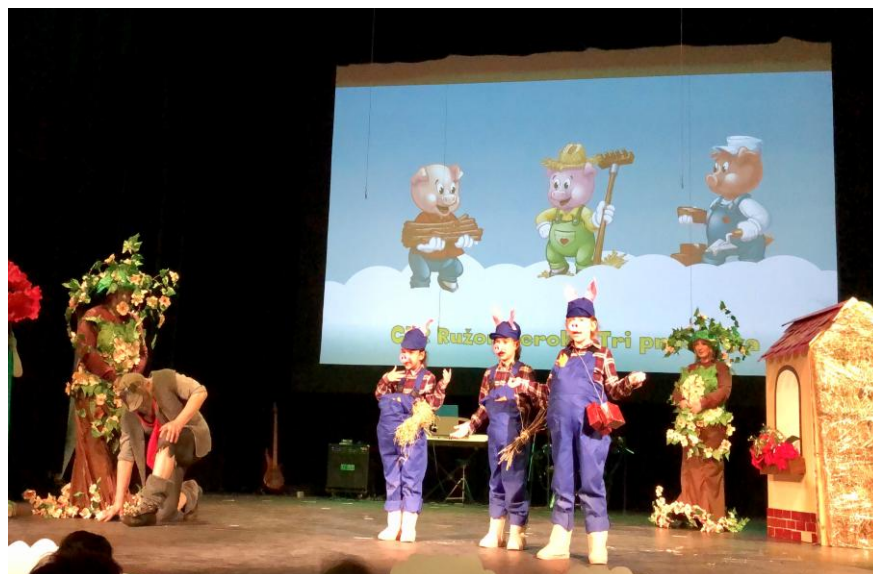
Divadielko Tri prasiatka