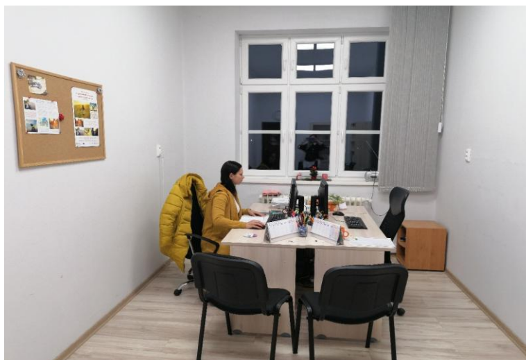
Kancelária č. 43