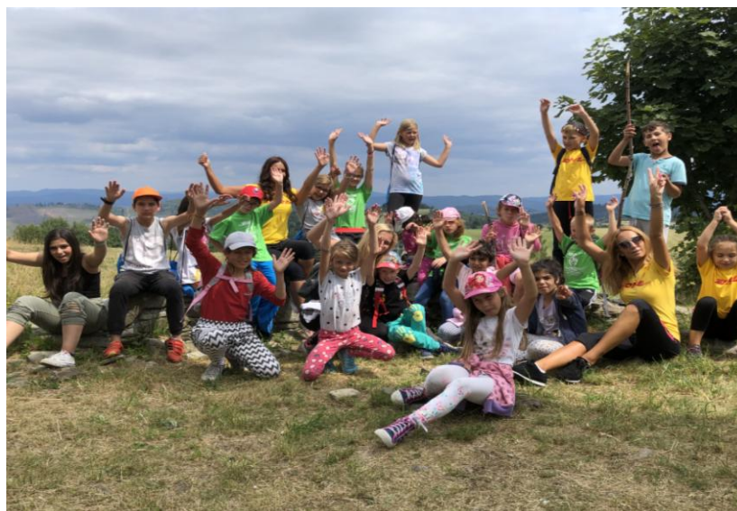
Letný rozvojový tábor „ Anglický tábor s úsmevom “