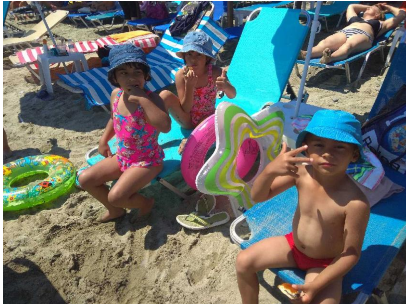
Letný prázdninový pobyt v Grécku – Leptokárii