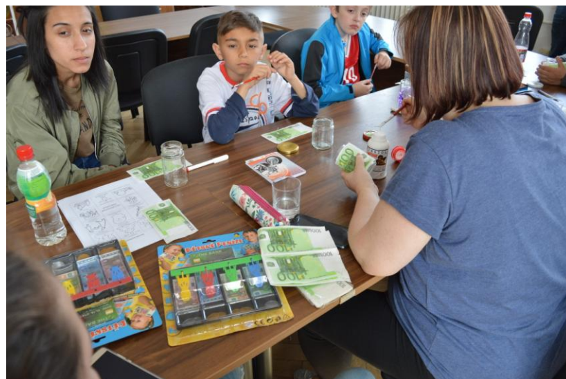
Projekt „ Život mladých pod kontrolou “