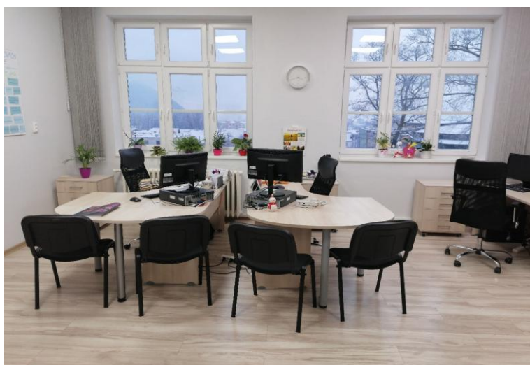
Kancelária č. 44