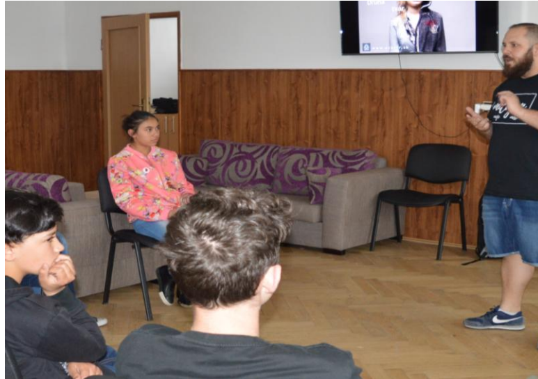
Prednáška „ Druhá tvár “