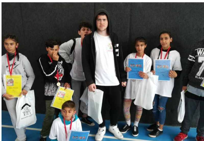
Krajské športové hry v Martine