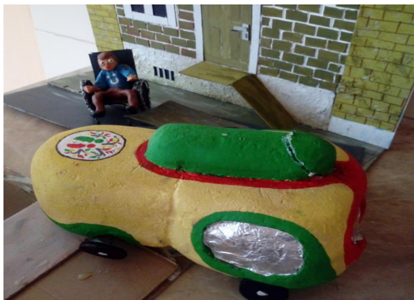
Vianočný projekt 2019: „Auto tolerancie“