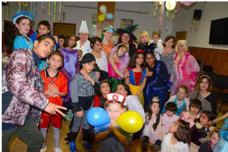
Karneval v CDR Ružomberok