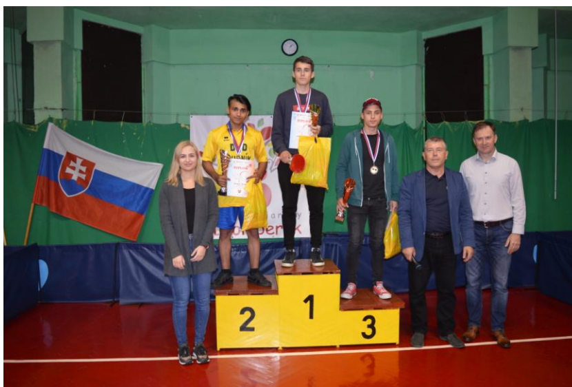
Stolnotenisový turnaj detí CDR Slovenska v Ružomberku